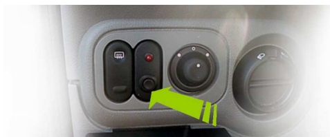
Bouton d'activation & indicateur lumineux

Au démarrage du véhicule, la pédale d'accélérateur de droite est fonctionnelle.